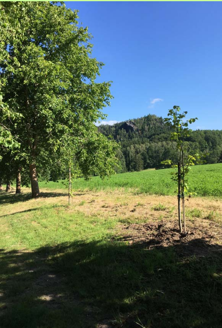
Baum-Hasel-Allee mit Blick zum Kleinen Bärenstein:

Die Nachpflanzungen vom Parkpflegeseminar 2018 sind alle gut angewachsen. Herzlichen Dank allen Mitwirkenden des Seminars und den Landschaftsgärtnern, die gegossen haben!