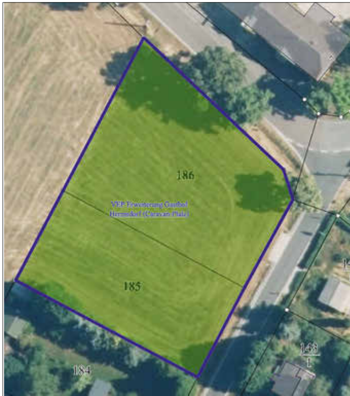
Übersichtsplan Geltungsbereich 6. Änderung des FNP bzw. des vorhabenbezogenen Bebauungsplans

Die Stellungnahmen können auch in elektronischer Form unter der E-Mail-Adresse bauamt@stadt-koenigstein.de abgegeben werden. Name, Vorname und Anschrift der Einwenderin bzw. des Einwenders müssen eindeutig lesbar enthalten sein.