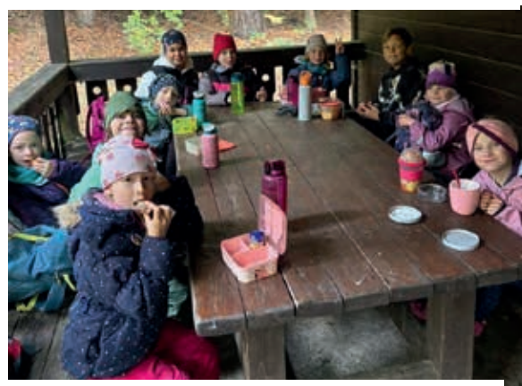
2. Wanderung nach Reinhardtsdorf-Schöna zum Naturpfad