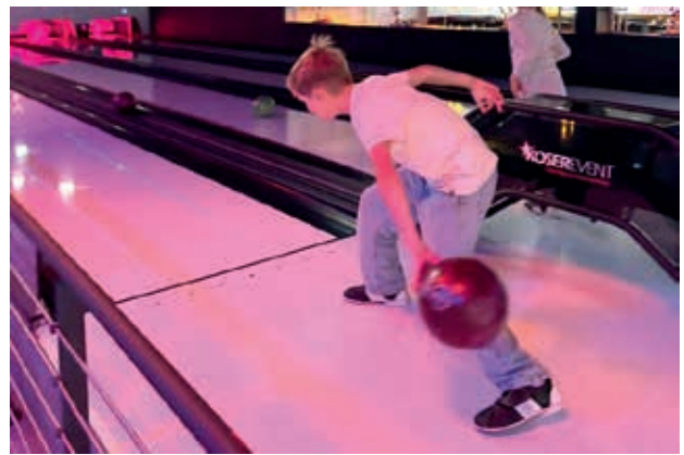
Sportlich war es beim Bowling im Sunshine in Pirna.