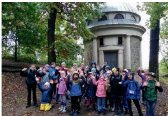
1. Wanderung zum Mausoleum in Thürmsdorf