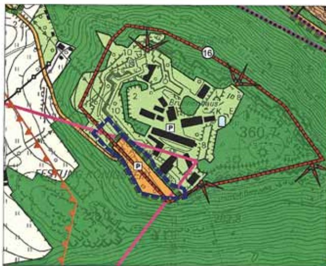
Bisherige Darstellung des Flächennutzungsplanes

Anlage zum Aufstellungsbeschluss vom 26.02.2018/26.03.2018