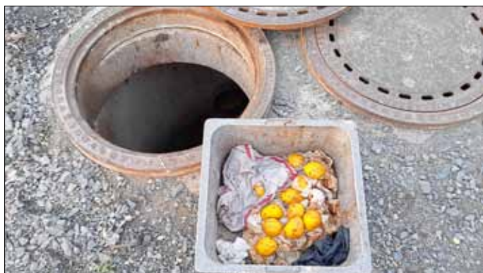
Aus dem Zulaufpumpwerk manuell entnommene Fremdstoffe (u. a. Orangen, Taschentuch)