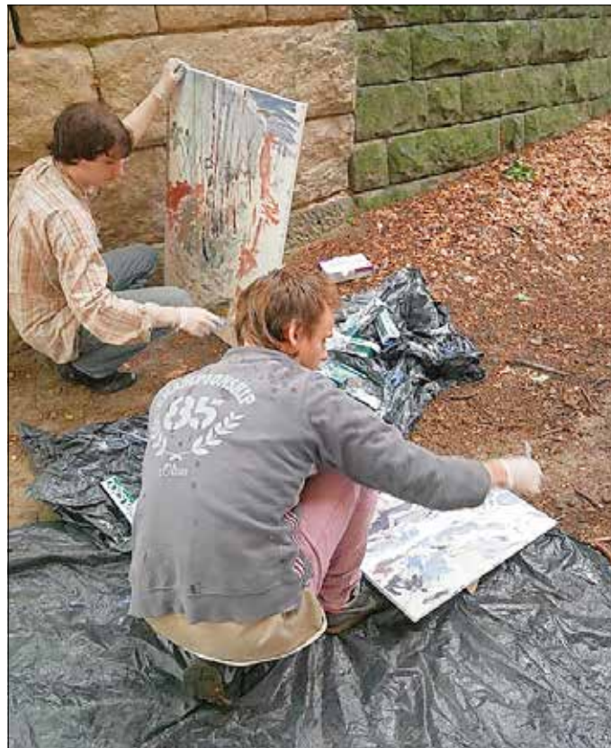
Impression vom Pleinair 2020 im Steinbruch Wehlen

Neugierige und kunstinteressierte Gäste sind zu den freien Arbeiten herzlich eingeladen und wünschenswert. Schauen Sie den Malern über die Schulter und lassen Sie sich von Musik und Tanz verführen.