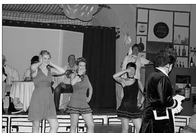
3 reizende Schwestern