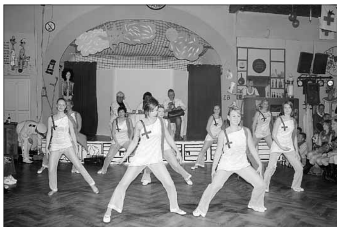
Tanz „Götter in weiß“