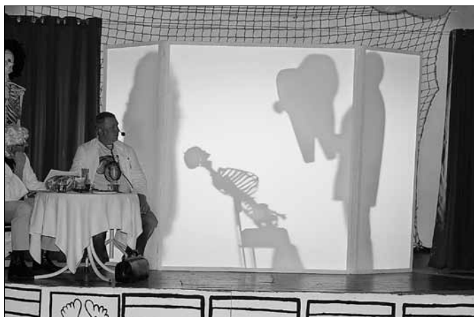
Weisheitszahn mit Wurzel