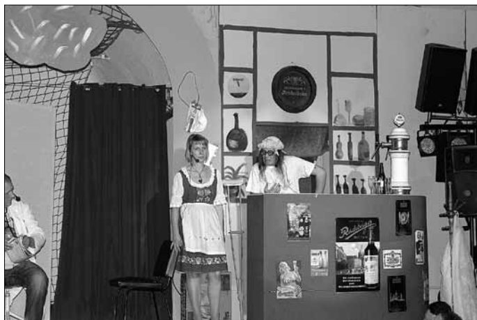
Koch ohne Plan