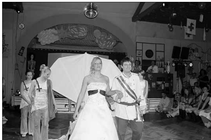
Das neue Prinzenpaar