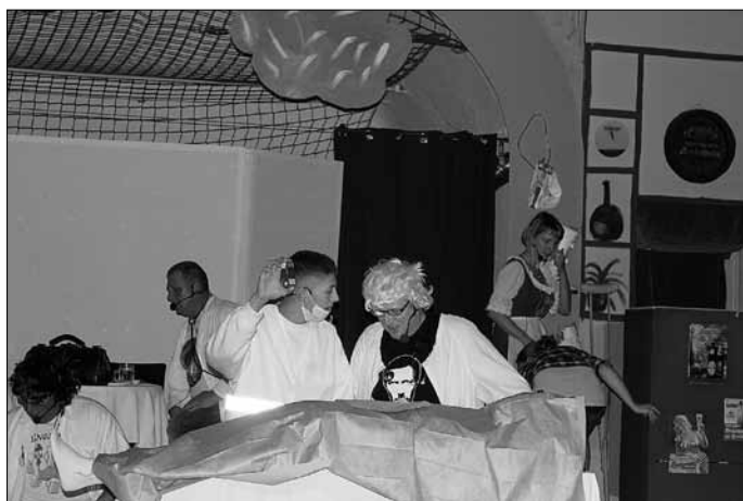
In der Pathologie