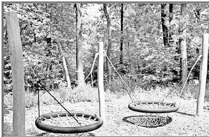
ZIEGLER Spielplätze von A bis Z Freizeitanlagen e.K., Zeitzitz

Informationen und Skizzen der ausgewählte Spielgeräte finden Sie auf der Infotafel am Parkplatz.