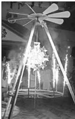
Feuerwerk - herrlich