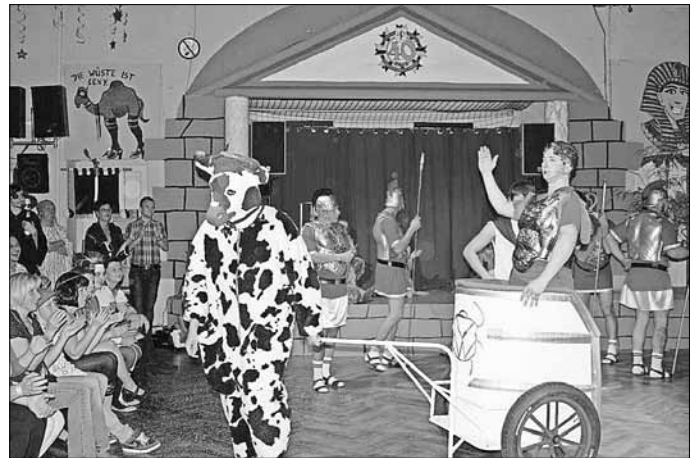
Einmarsch Julius W. Cäsar