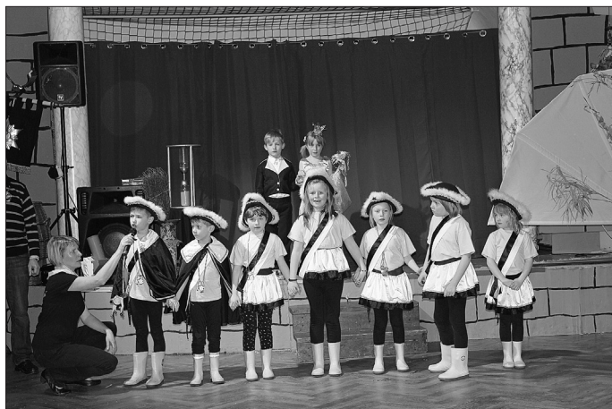
Minifunken mit Kinderprinzenpaar

Viele schöne Stunden haben lustige Närrinnen und Narren auf dem Saal verbracht.