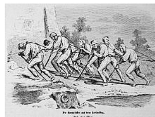
Die Bomätscher auf dem Treidelsteg.

Altes Kino Königstein, Goethestraße 18 Eintritt frei, Spende erbeten